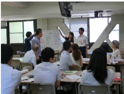
3102B 大学教職員のための留学生受入実践 ：最初の1ヵ月