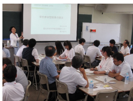
2903A 学生参加型授業の技法