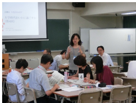
2901B グループワークで学ぶ自校の歴史 - 「香川大学検定」を例に -