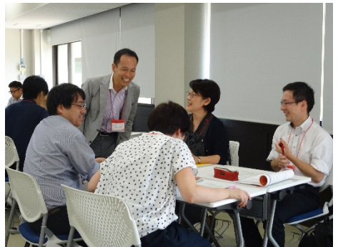
2903D 大学職員のための フィードバック入門