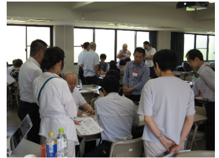
3101A 授業内グループワークへの 参加意欲を高めるための アイデア