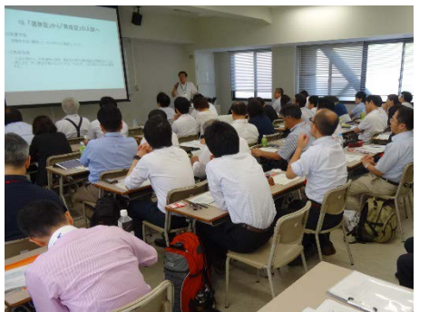
3001E 【トップリーダーセミナー】 管理職のための、 新たな入試・学生募集・高大接続を 考えるセミナー