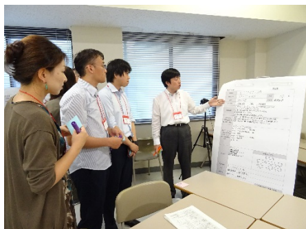
2902F SD 担当者研修 - 戦略的な人材育成をするために -