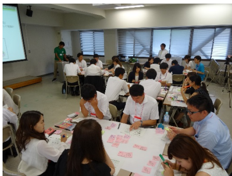
2903E 若手職員に知ってもらいたい 「報・連・相」のコツ -もっと良くなる 職場内コミュニケーション-