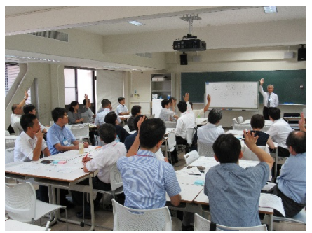
2902C 大人数講義のコツ