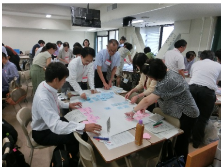
3002B 初年次教育における シナリオ型 PBL の実践