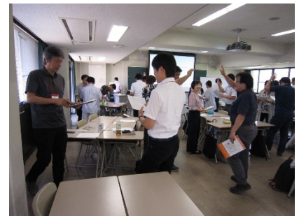
3102A ルーブリック評価入門 -考える、つくる、活用する-