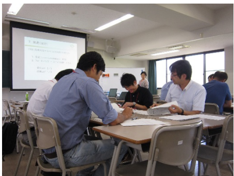
3001A シラバス・授業を改善しよう！