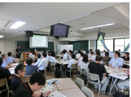
2902B 今さら聞けない ICT 利用による 教育の意義と方法