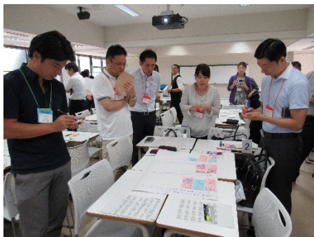
3001C 学生・若手職員の ミニマム・エッセンシャルズを考えよう！ -成長を促す振り返りにむけて-