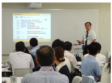
2901D 大学職員の基礎力を考える