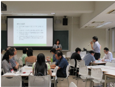
2903C 教職協働で学習支援に取り組む -理想と現実のギャップを埋めよう-