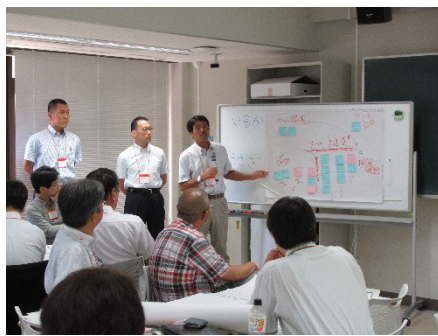
2901C 反転授業をやってみよう - 橋本メソッドの実践から -