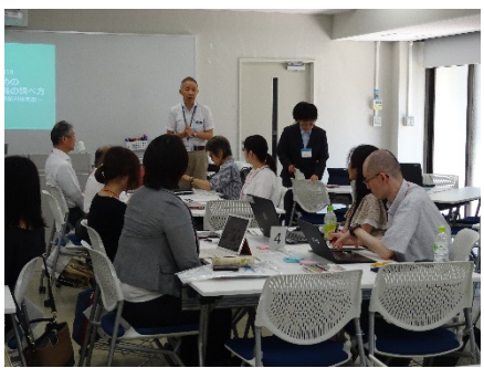
2902D 図書館員のための アジア諸国情報の調べ方 - 留学生に対する図書館利用支援 -