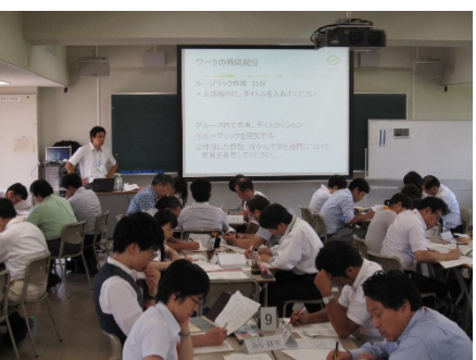
2902A 基礎から学ぶ学習評価法