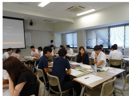
2902E 若手職員のための キャリア形成入門