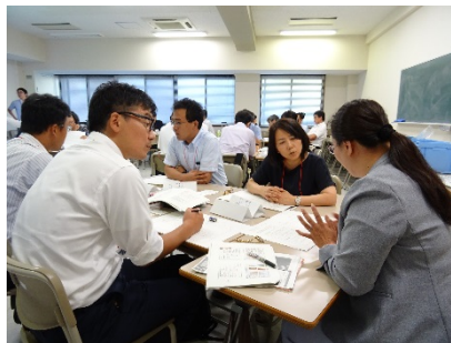
3101F FD 担当者研修 -問題解決のためのFDを設計する-