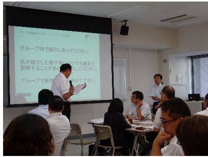
3002F 教職課程事務担当者の基礎力講座 -教職課程事務の学び方と 知識の活用方法-