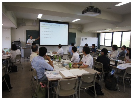
2901A 学生の学びを促すシラバスの書き方