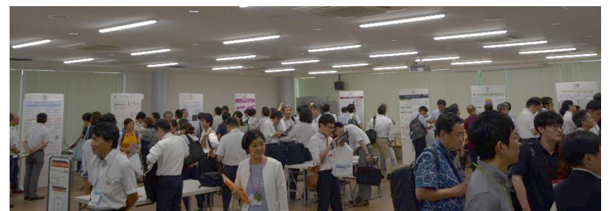
ポスターセッション