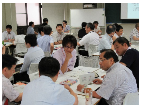
3002C 中堅教員のための研究指導講座 (大学生の卒論作成を支援する方法)