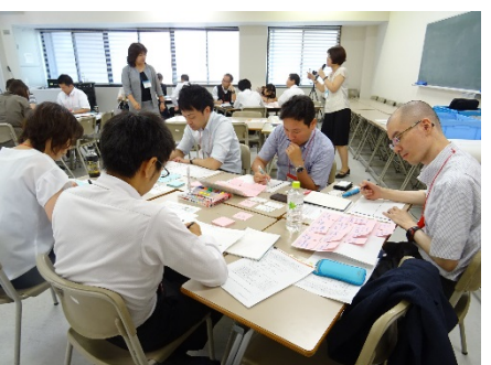
2901F 職員のための SP 作成ワークショップ