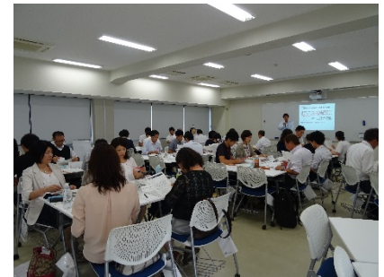
3101D 職員のための 「前向きな職場づくり」実践 -個の力・組織の力を活かす-