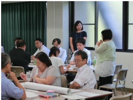
2903B 学生のためのキャリア形成支援