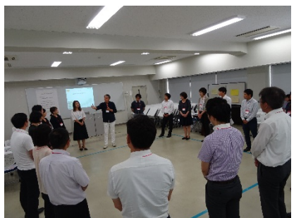
3102D 5年後のなりたい自分像のために -何から始めますか？-