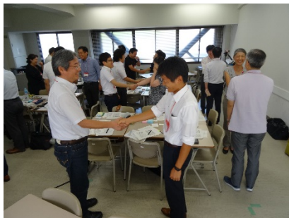
3101E 教職員のための「大学の危機管理」 -事例から考えるハラスメント-