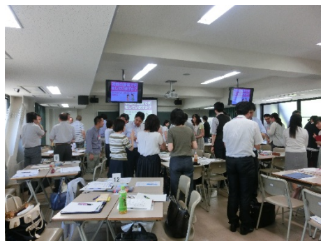
3001B 大人数でも進度を落とさず アクティブラーニング -TBL と言う反転授業のやりかた-