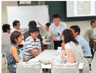
3101C 学生の学ぶ意欲を引き出す 授業とは？