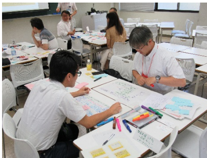
3102C グラフィックシラバスを書こう