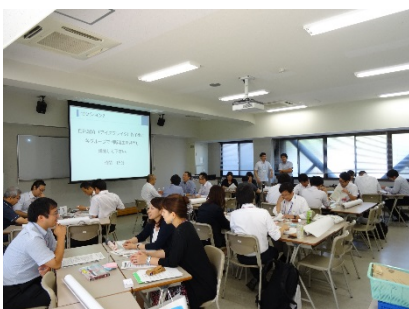
3102E ケースメソッドを活用した能力開発 (SPOD フォーラム 2016 優秀ポスター賞受賞組)