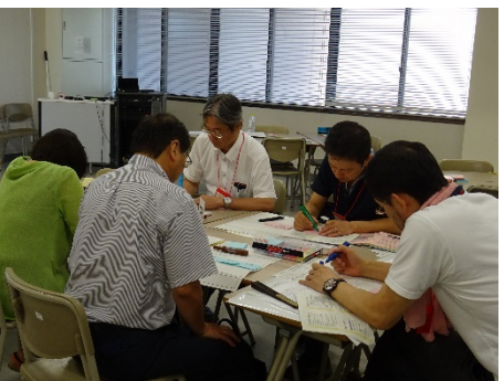
3001F 理工系講義形式授業における 1回の授業デザイン