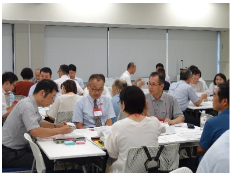
3001D 数学 IR データを 適切に取り扱うために -組織または個人で できることを考える-