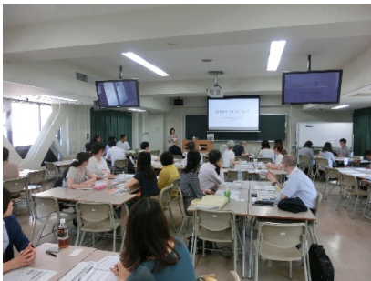
3101B 障害学生の支援について